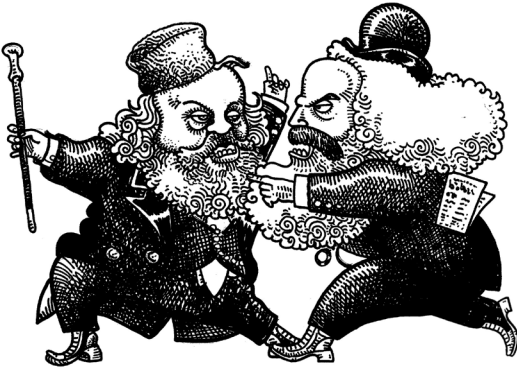
AIL Bakunin vs. Marx

AIL - Associazione Internazionale dei Lavoratori, conosciuta anche come Prima Internazionale - Organizzazione internazionale fondata nel 1864 per unire operai e socialisti di diverse correnti. Inizialmente marxisti e anarchici collaborarono, condividendo l'obiettivo della liberazione dei lavoratori. Il conflitto tra approcci autoritari e libertari portò però, nel tempo, all'emarginazione di Bakunin (vedi), portavoce dell'anarchismo antiautoritario, e dei suoi sostenitori.